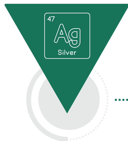
SILVER до 50 га (включено во все пакеты)